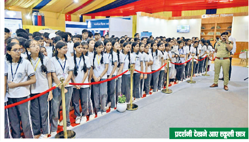
प्रदर्शनी देखने आए स्कूली छात्र

प्रदर्शनी में शुरूआती दौर में 2 या 3 शो ही दिखाए गए। इस शो का समय लगभग 30 मिनट का रखा गया है, लेकिन लोगों की डिमांड के अनुसार अब रोजाना 5 शो लोगों को दिखाए जा रहे हैं। इस 30 मिनट के शो में कंट्रोल रूम, घटना स्थल, थाने की प्रक्रिया, पोस्टमार्टम, एफएसएल की सैम्पलों की ऑनलाइन रिपोर्ट, जिला न्यायवादी कार्यालय की प्रक्रिया, जेल और फिर अदालत की प्रक्रिया को ह्यूबू दिखाया गया है। इस 30 मिनट के शो में आम नागरिक सहजता से नए आपराधिक कानूनों के लागू होने के बाद कानूनी प्रक्रिया में आई तेजी और ऑनलाइन कार्यप्रणाली को विस्तार से दिखाया गया है।