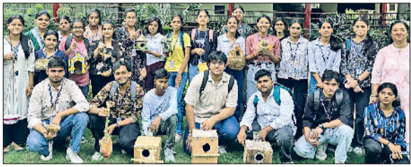
पक्षियों के लिए बनाए गए पक्षी आवास के साथ विद्यार्थी।

एसडी पीजी कॉलेज में 2 से 8 अक्टूबर तक मनाये जा रहे राष्ट्रीय वन्य जीव संरक्षण सप्ताह के माध्यम से विद्यार्थियों को जागरूक किया गया ताकि वे पर्यावरण संरक्षण और वन्य जीवों की सुरक्षा को लेकर संजोदा हो और इनकी रक्षा को सुनिश्चित करें। इस अवसर पर पोस्टर और स्लोगन लेखन प्रतियोगिताओं का आयोजन किया गया। जिसके विजेताओं को नकद पुरस्कार और सर्टिफिकेट्स से सम्मानित किया गया।