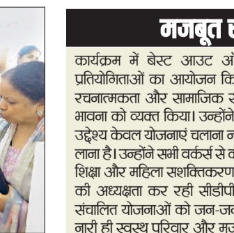
नारायणगढ़। कार्यक्रम में हिस्सा लेती एसडीएम व अन्य अधिकारी।

कहा कि बेटियों का जन्म, शिक्षा और पोषण किसी भी समाज की प्रगति की नींव है। उन्होंने कहा कि यह गर्व का विषय है कि सरकार द्वारा संचालित बेटी बचाओ-बेटी पढ़ाओ अभियान