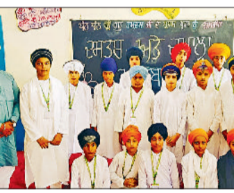
बराड़ा। प्रतियोगिता में विजेता रहे स्टूडेंट्स।

प्रस्तुत कर सभी उपस्थित जनों को गुरुबाणी के रस में भाव-विभोर कर दिया। विद्यार्थियों ने अपने प्रेरणादायक भाषणों के माध्यम से गुरु राम दास के जीवन, शिक्षाओं