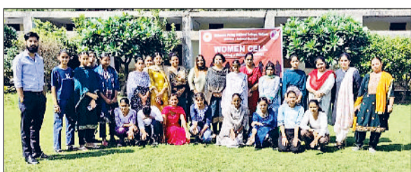
अंबाला। कार्यक्रम में भाग लेते हुए स्टाफ और स्टूडेंट्स।