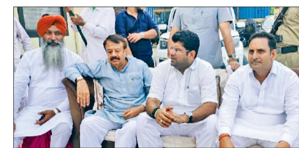
तरावड़ी। पत्रकारों से बातचीत करते पूर्व उपमुख्यमंत्री दुष्यंत चौटाला।