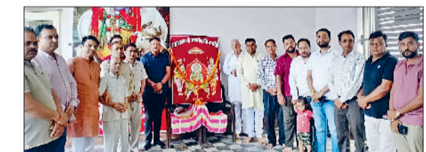
अजमीठ जी महाराज के ये सच्चे घोटक

युवा फाउंडेशन हरियाणा के सदस्यों एवं स्वर्णकार समाज के पदाधिकारियों ने धरोड़ा की गुरुचरंद संरक्षण समिति गौशाला में महाराजा अजमीठ जी महाराज की जयंती के उपलक्ष्य में गौ सेवा एवं पुष्पांजलि सभा कार्यक्रम आयोजित किया गया। सर्वसमाज के सदस्यों ने महाराजा अजमीठ जी के चित्र पर पुष्प अर्पित कर उन्हें नमन किया।