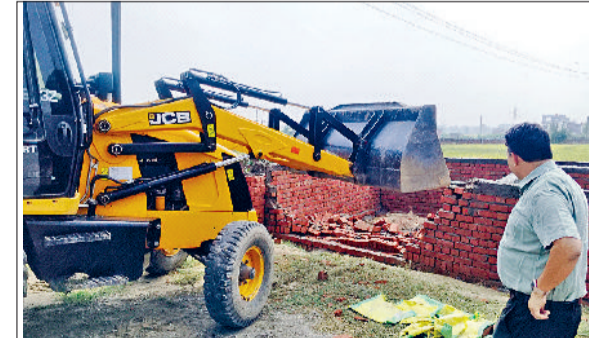
धरोड़ा। शहर में अवैध कॉलोनीयां पर कार्रवाई करती नगरपालिका की टीम।

शहर में एक अवैध कॉलोनीयां में सड़को बनाने का कार्य शुरू हो गया है। जिसको लेकर नगरपालिका पनोडी रोड स्थित एक कोटिया कॉलोनी में पीला पंजा चलाकर सड़को को ध्वस्त कर दिया। वहीं बरसत रोड पर एक कॉलोनी को नगरपालिका अधिकारियों ने नोटिस जारी कर दिया है। अधिकारियों के अनुसार कॉलोनी में शीघ्र ही कार्यवाही की जाएगी। नगरपालिका की पीले पंजे की कार्रवाई से कालोनाइजर्स में